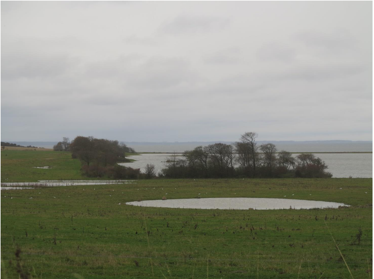
Udsigt over de gåserige enge der er genskabt inden for de seneste år. Færdsel her er voldsomt forstyrrende.

Et besøg ved Bøjden Nor 15.11.2017 sammen med en af mine gode venner skulle lige kaste lys over om bjergænderne var ankommet til noret. Når jeg besøger min ven i Faaborg er det ofte at vi besøger det dejlige fuglefristed Bøjden Nor. Vi ser ofte store skarer af gæs på de relativt nyligt tilkøbte engarealer. Og i selve noret oplever vi ofte store skarer af dykænder, herunder bjergænder.